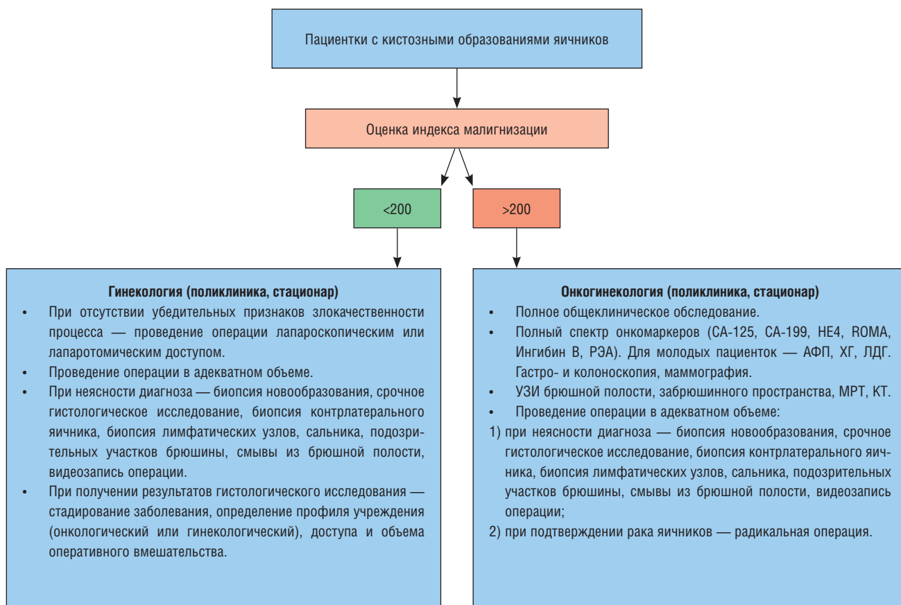
Рис. 2. Медико-организационные аспекты ведения пациенток с кистозными образованиями яичников с использованием индекса малигнизации.

разованиями яичников. Дифференцированный подход в зависимости от показателя индекса позволяет оптимизировать медико-организационные аспекты ведения таких больных, своевременно изменив тактику и направив пациентку в профильное учреждение. Медико-организационные аспекты представлены на рис. 2.